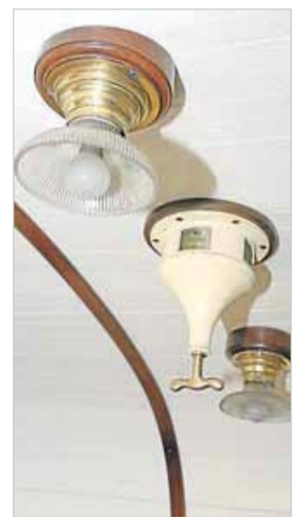
Der er masser af detaljer ved de gamle tog. Her er der for eksempel elegante lofislamper.