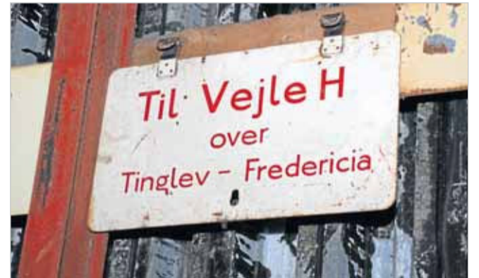
De gamle skilte er fulde af historie. Her nævnes for eksempel Vejles hovedbanegård.