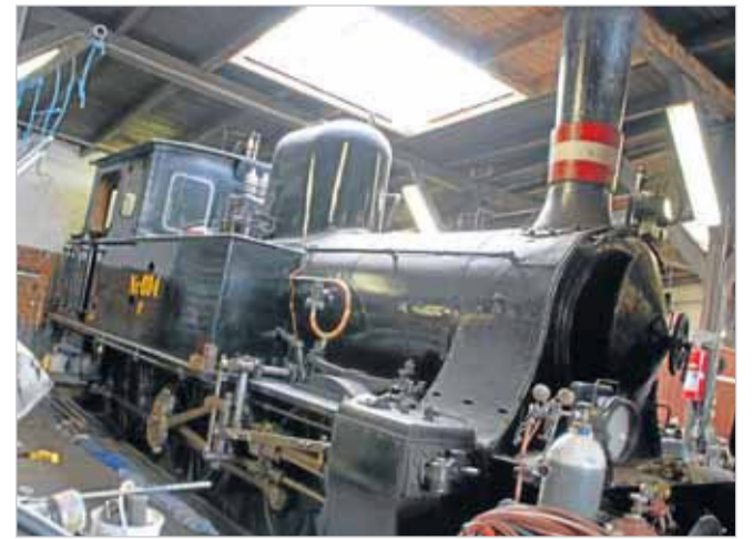
KLK's gamle lokomotiv, der ikke kunne passere gennem "synet".