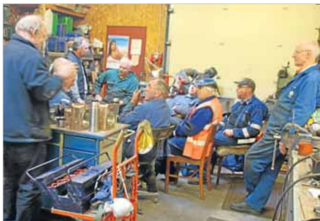
Kaffepausen holdes i remisens eneste opvarmede værksted.