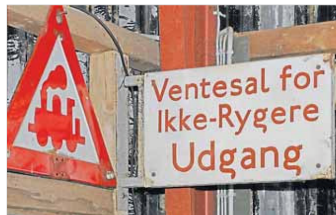
Der var engang, hvor det var ikke-rygerne, der måtte nøjes med særlige rum.